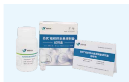
细胞悬液制备系列试剂