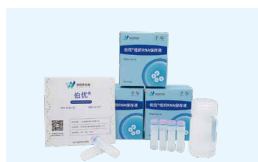
核酸保存系列试剂