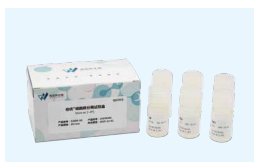
细胞核分离系列试剂