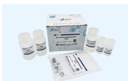
核酸提取系列试剂