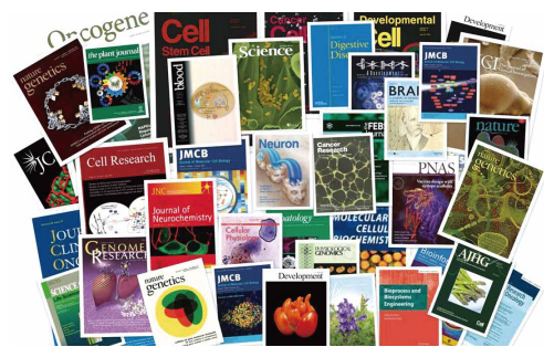
伯豪生物协助客户发表相关文章